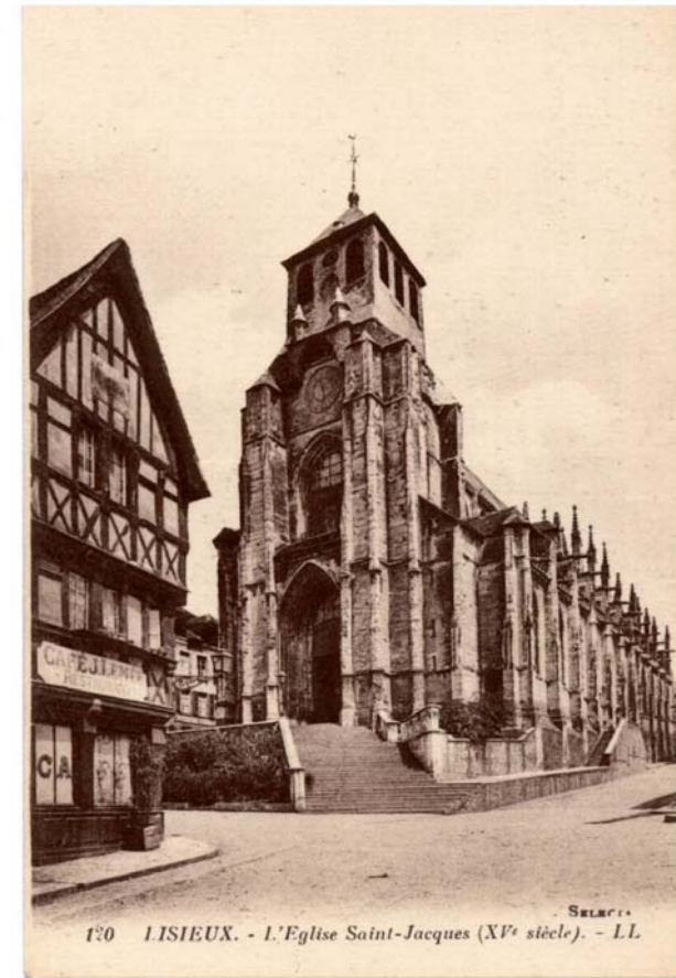
130 LISIEUX. - L'Eglise Saint-Jacques (XV e siècle).