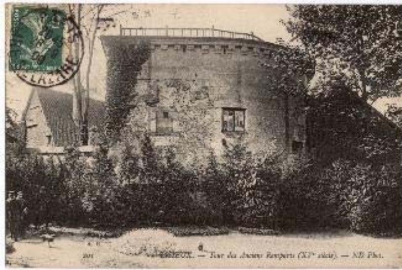
''la Tour Lambert'' : Tháp Lambert tại thành phố Lisieux, đường 'Quai des Remparts'.