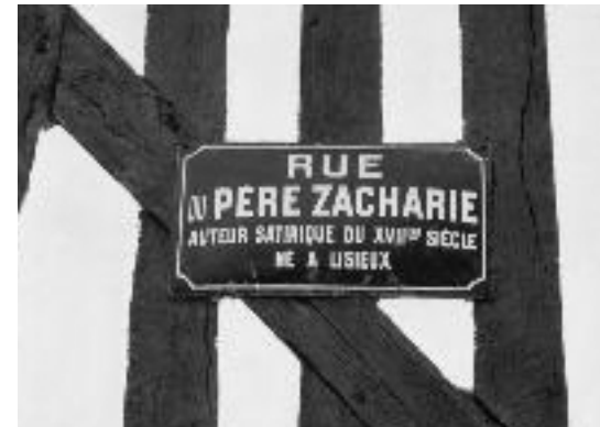
Con đường Père Zacharie tại Lisieux. (Hình chụp 01.1999)