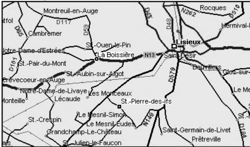
La Boissière và La Motte ngày nay.