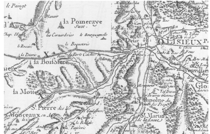
La Boissière và La Motte ngày xưa. (Bản đồ hậu bán thế kỷ 18).

(D.Fournier : Dictionnaire historique et étymologique des noms de rues..., Lisieux, 1998)